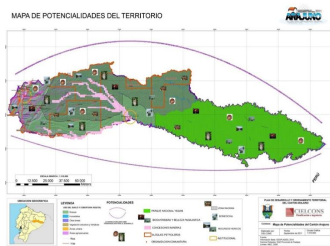
Figura 2. Mapa de Potencialidades del Territorio Arajuno

El Ecuador está ubicado en Sudamérica, formado por cuatro regiones: Costa, Sierra, Oriente y Galápagos, en la provincia de Pastaza se encuentra el cantón Arajuno es el cuarto de la Provincia y se encuentra integrado por la parroquia urbana Arajuno y la parroquia rural Curaray (Gobierno Autónomo Descentralizado Municipal Intercultural y Plurinacional del Cantón Arajuno, 2018).