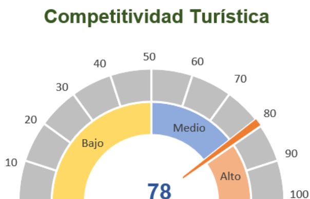
Figura 3. Resultado de Indicador de Competitividad Turística

y con lo antecedido se puede definir que la capacidad de emprender es alta en un 78,77% presente en el sector mientras que el indicador empresarial sobre los datos recabados se situó en un 3,89% tomando en cuenta todas las actividades económicas que en el sector se dan. A continuación, se muestra la Figura que indica su capacidad de emprendimiento.