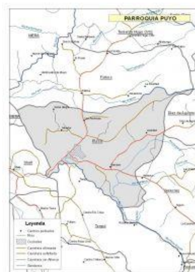
Figura 2. Mapa de la parroquia Puyo

Ríos: Entre los más importantes están: Puyo, que sirve en la cuenca baja como medio de recreación turística y sustento de comunidades indígenas kichwas y colonas; el Pindo Grande; el Pindo Chico, el Pambay, el Sandalias y el estero La Talanga que cruza por la ciudad de Puyo con rumbo Noreste al Sur. El clima de Puyo oscila entre los 17° C y 24° C.