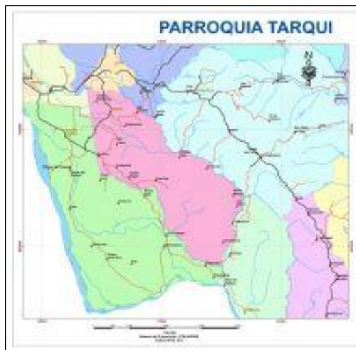
Figura 3. Mapa de la parroquia Tarqui

Ríos principales: Chicicoyaku, Puyo, Pindo, Grande, Paliaba y Mamayaku, entre los más importantes del sector.