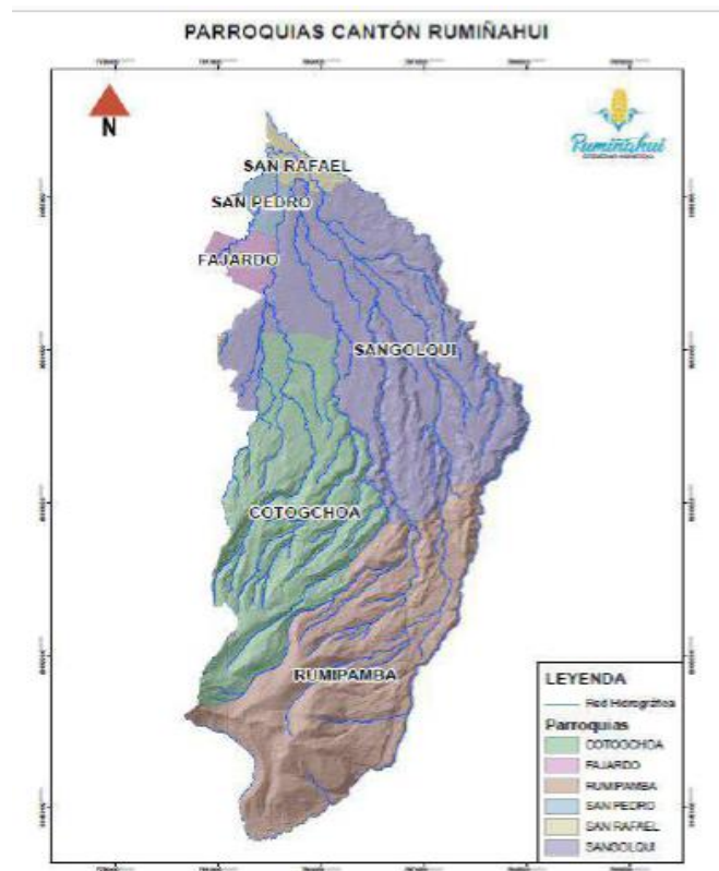
Ilustración 2. Mapa del cantón Rumiñahui

El cantón Rumiñahui se encuentra ubicado al sur occidente de la provincia de Pichincha, siendo el más pequeño, conformado por una extensión de 134.15 km Gobierno Autónomo Descentralizado Municipal del Cantón Rumiñahui (GADMUR) (2020). De la misma manera está constituido por seis parroquias; Sangolquí, San Rafael, San Pedro de Taboada, y Fajardo corresponden a la zona urbana, mientras que Cotogchoa y Rumipamba son parroquias rurales GADMUR (2020). En cuanto a sus límites políticos se encuentran los siguientes; Al norte Distrito Metropolitano de Quito, al sur cantón Mejía, al oeste parroquias rurales de Amaguaña y Conocoto pertenecientes al Distrito Metropolitano de Quito (DMQ), al este están Alangasí y Pintag parroquias rurales también pertenecientes al DMQ (GADMUR. 2020)